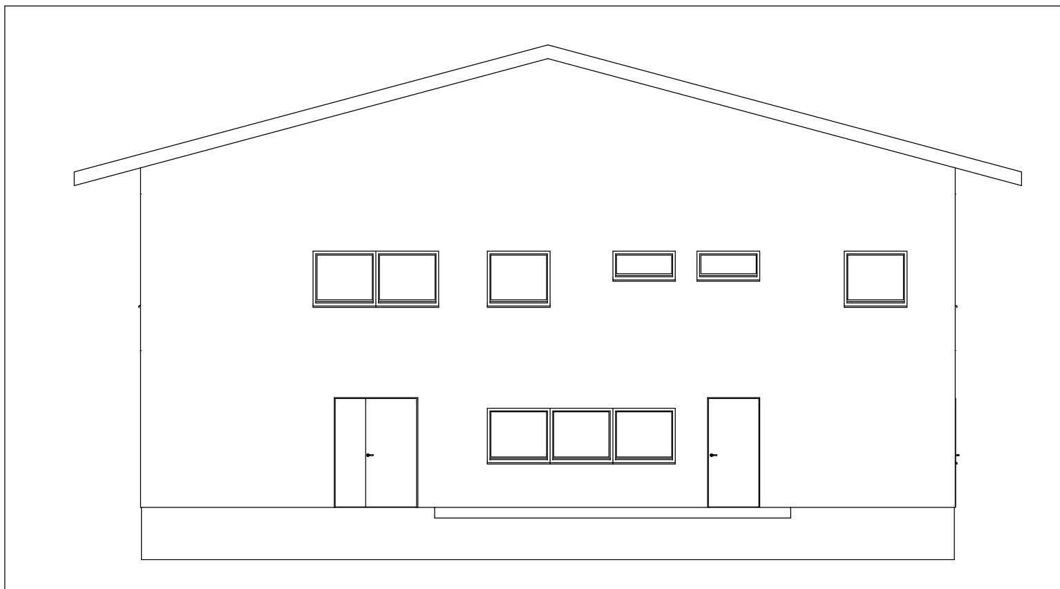
JS C010 JS itään 1:100